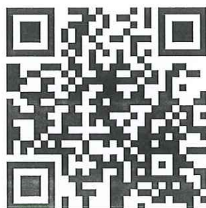
สแกน QR code