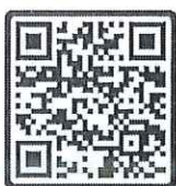
เอกสารแนบ 1

ผู้อำนวยการสำนักงานคณะกรรมการส่งเสริมวิทยาศาสตร์ วิจัยและนวัตกรรม